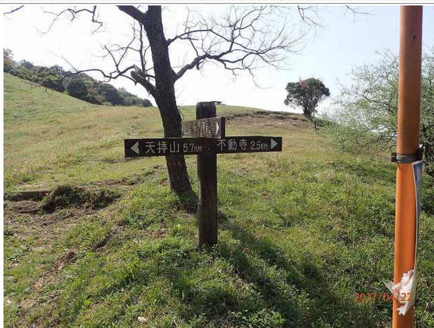
基い城周辺の自然歩道