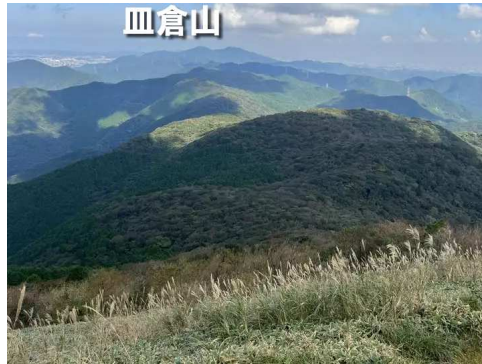
福智山から皿倉山を望む