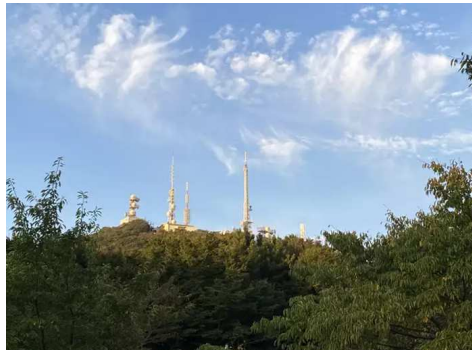
鉄塔が並ぶ皿倉山も近い