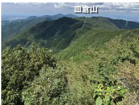
尺岳から皿倉山を望む