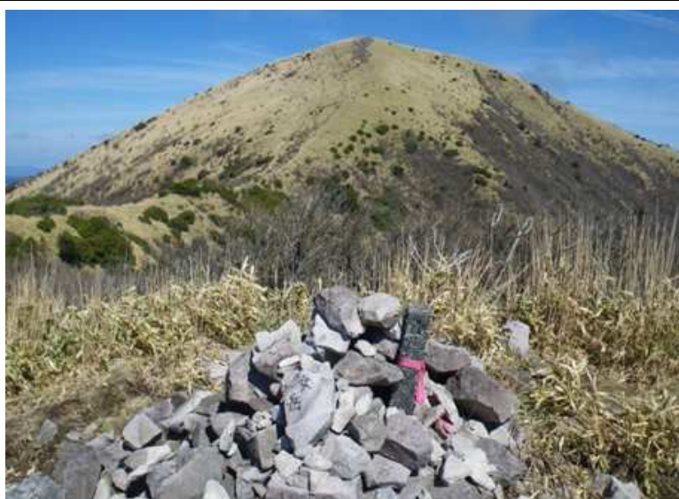
(手前にある女岳から涌蓋山)

ガイドクラブ：0952-37-0577 当日 (池田)：080-1772-8359