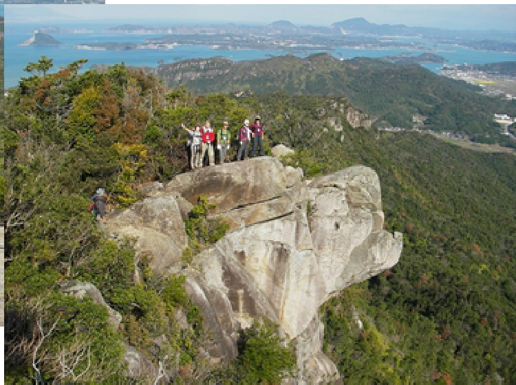
⇒が亀次郎岩、高度感抜群