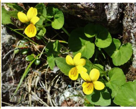
キバナノコマノツメ