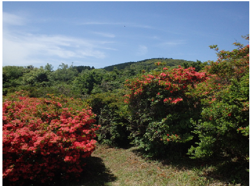
ツツジの群落から隠居岳山頂方面を望む