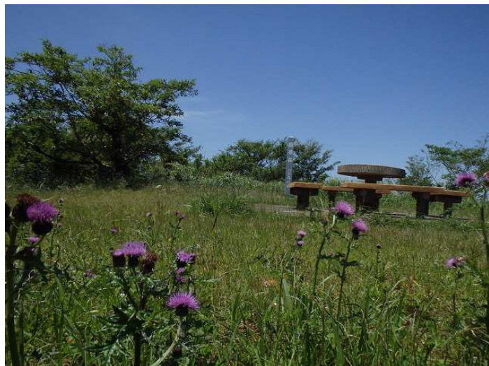
写真は隠居岳山頂の草原とノアザミ